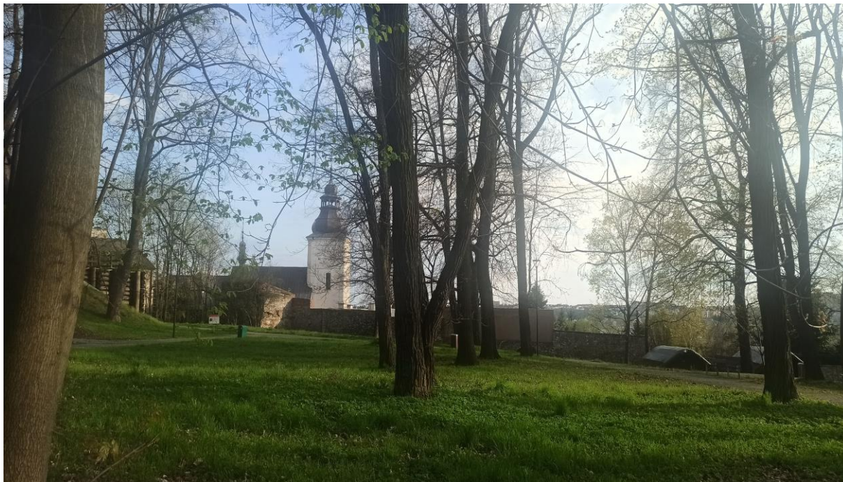
Park na wzgórzu Zamkowym z fragmentami murów obronnych i elementami odtworzonych budowli typu ziemiankowego, na drugim planie sylweta kościoła św. Trójcy