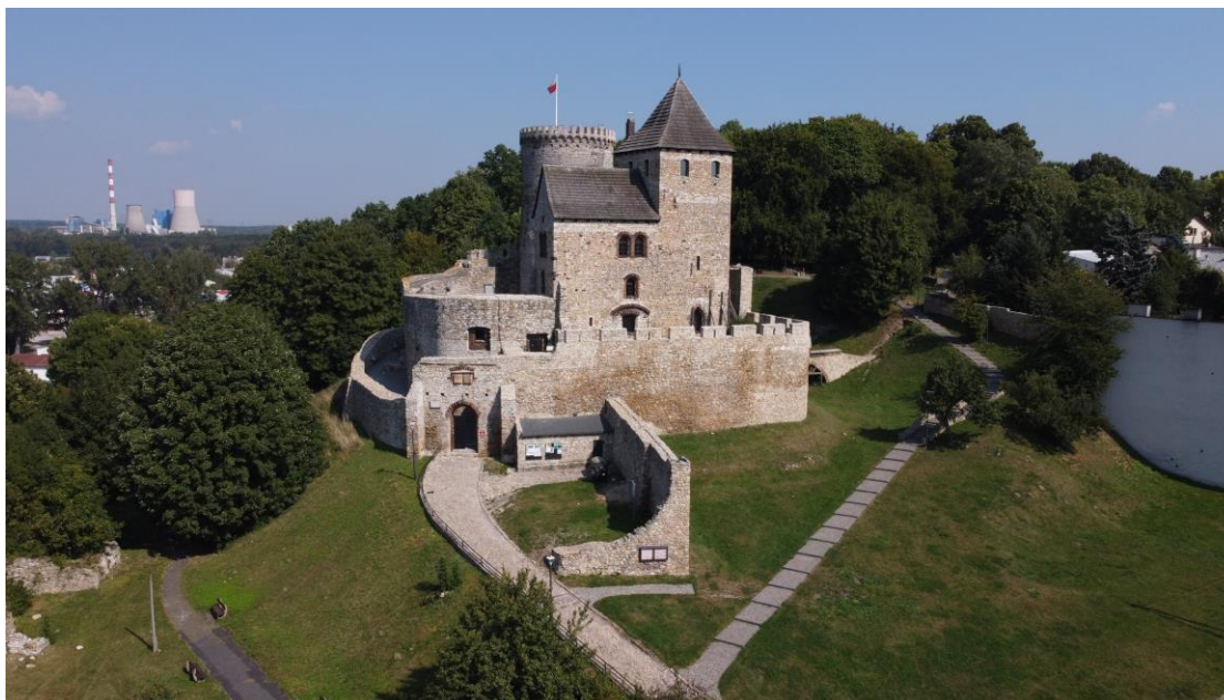
Wzgórze Zamkowe z dominantą zrekonstruowanego w latach 1952-56 Zamku, według projektu inż. Zygmunta Gawlika, w otoczeniu zrewitalizowanego parku. Widok od strony ronda zwanego "nerką". W tle widoczne zabudowania Elektrowni Łagisza.