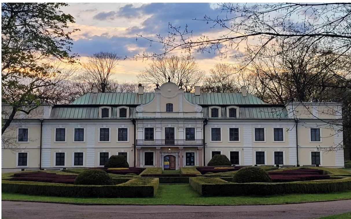
Pałac Mieroszewskich, wzorowany na ówczesnych pałacach francuskich. Reprezentacyjny wjazd frontowy z założeniem ogrodu w stylu francuskim.