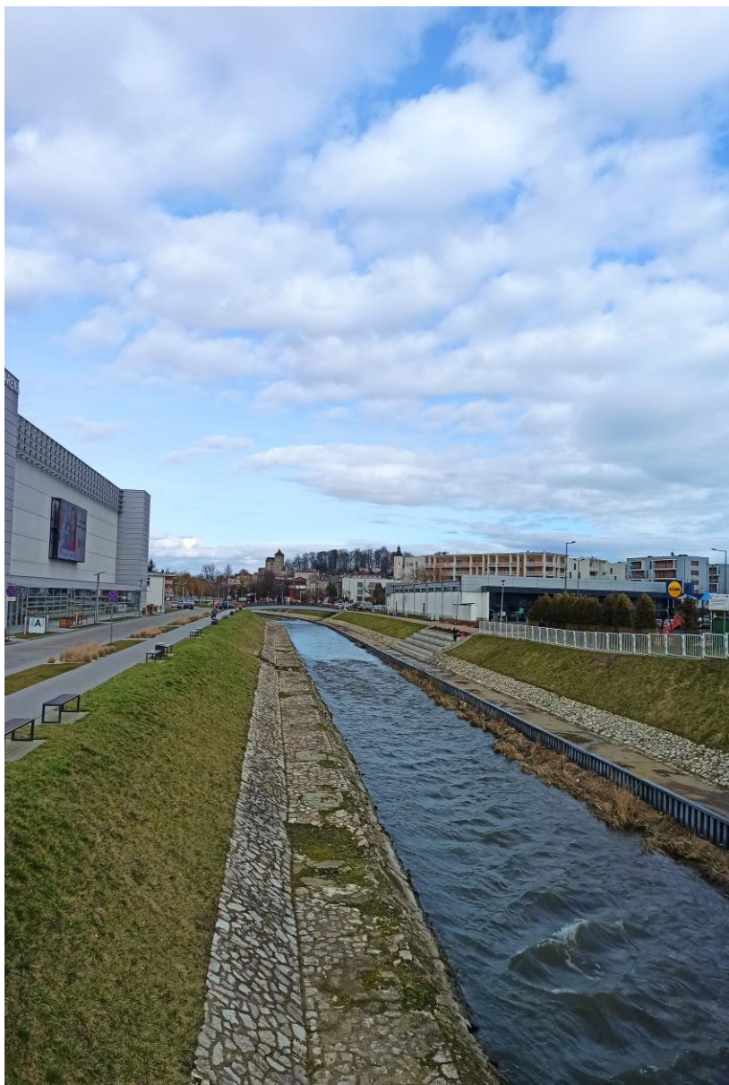
ZDJĘCIE NR 5

Uregulowane koryto Czarnej Przemszy w centrum Będzina. Zrewitalizowane bulwary nadrzeczne. Widok na Wzgórze Zamkowe z dominantą zamku i Kościoła św. Trójcy. Na pierwszym planie zabudowa związana z usługami (hala sportowa Arena i centrum handlowe).